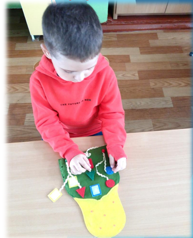
«Найди свой домик»