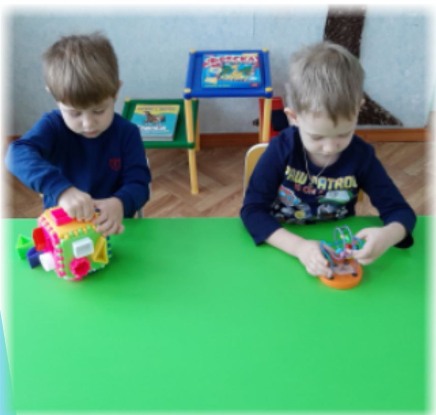
Треугольник - три угла, Посмотрите детвора